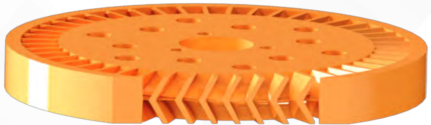
Imagen 3D de turbina

Esta es la vista en corte de nuestra bomba que reemplaza a la tipo Marelli comúnmente llamada "con pico verde de costado".